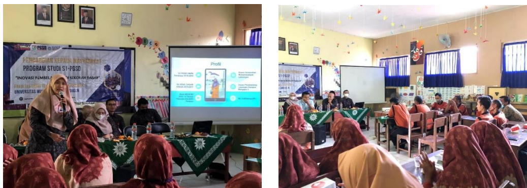
Gambar 1. Kegiatan Pelaksanaan Sosialisasi

Pada tahap ini, tim penyaji memaparkan materi sosialisasi landasan pendidikan dalam Kurikulum Merdeka kepada para guru di MI Muhammadiyah 16 Karangasem. Pemaparan materi dilakukan dengan metode ceramah dan presentasi dengan menggunakan media visual seperti slide presentasi. Setelah pemaparan materi, dilanjutkan dengan sesi diskusi dan tanya jawab. Para guru dapat mengajukan pertanyaan, tanggapan, atau kendala terkait landasan-landasan Kurikulum Merdeka. Sesi ini bertujuan untuk meningkatkan pemahaman guru terhadap materi yang disampaikan. Selain ceramah dan diskusi, juga dilakukan metode studi kasus terkait implementasi landasan-landasan Kurikulum Merdeka dalam proses pembelajaran di sekolah dasar. Hal ini untuk memberikan gambaran nyata kepada guru dalam mengaplikasikan landasan-landasan tersebut dalam kegiatan belajar mengajar. Berikut dokumentasi kegiatan pengabdian.